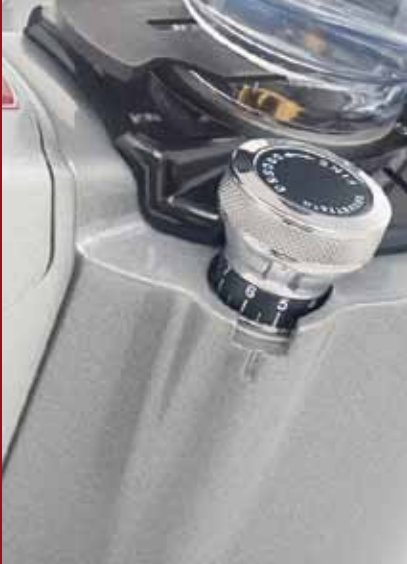
Pomello di regolazione micrometrica Eureka Innovative micrometric regulation

Tutta la gamma Zenith on demand è dotata della regolazione micrometrica della macinatura Eureka. Tramite lo scorrimento assiale del rotore le macine vengono regolate con facilità e precisione garantendo una granulometria ideale in funzione del caffè e delle condizioni operative.