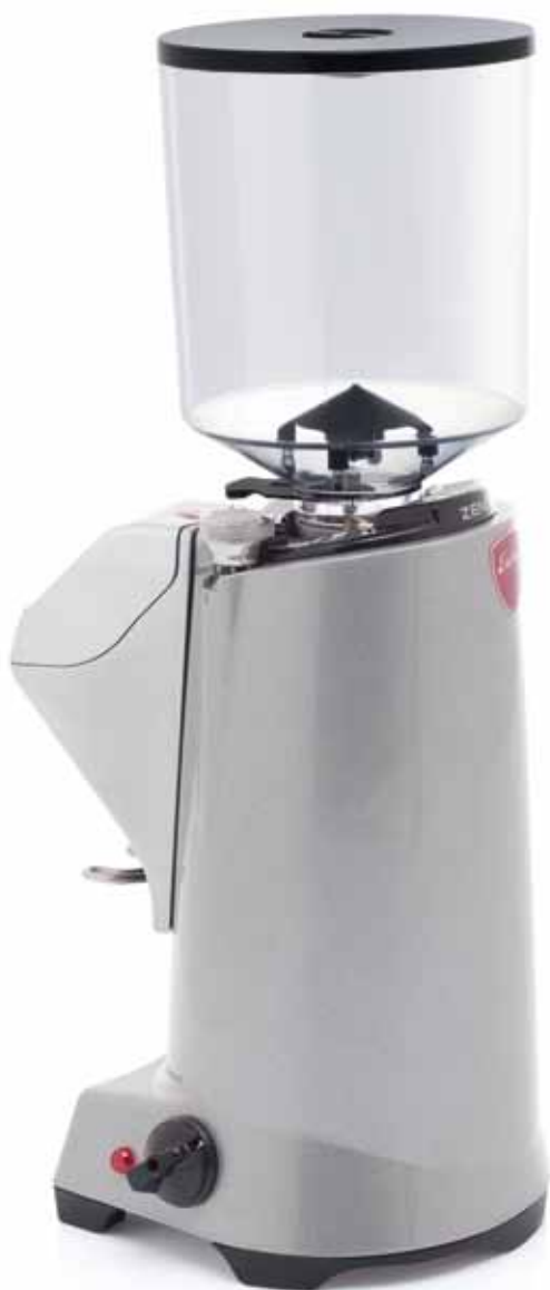
Mod. Zenith 65 E