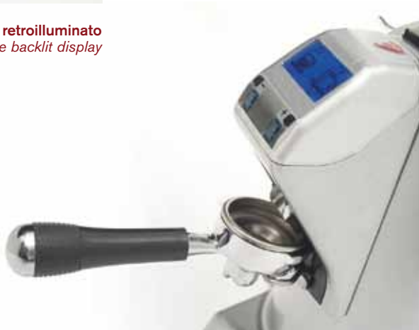
Sistema di supporto portafiltro in fase di macinatura Support system for filter holder