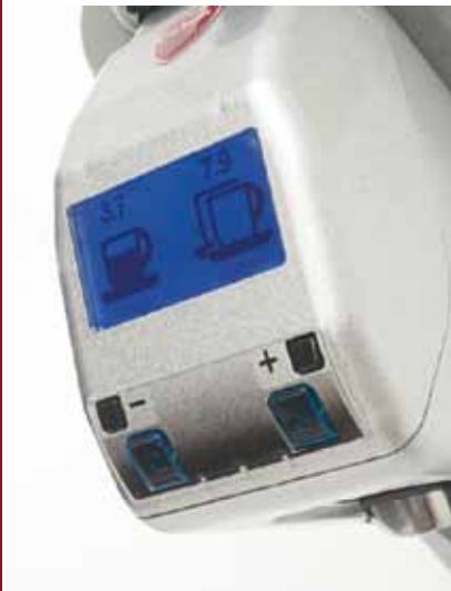
Ampio display retroilluminato Wide backlit display

The ground coffee is channeled into a canal adjustable to avoid any leakage. The homogeneity of doses delivered is guaranteed by a perfect electronic control system.